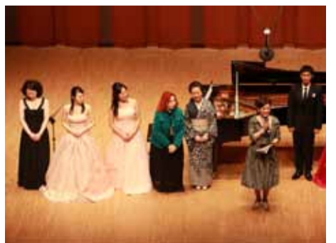
▲2016年・紀尾井ホール コンチェルト・ディ・プリマヴェーラ (演奏会)