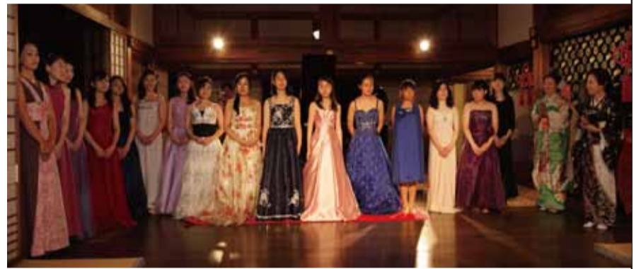
▲ 京都の名寺・高台寺での特別演奏会(定期演奏会)。格式高い「方丈」での演奏は、音楽家にとっての誉れとなる。外国からの観光客も多く参詣するなかで、その素晴らしい音色を堂々と披露する姿は、毎秋の風物詩ともなっている。