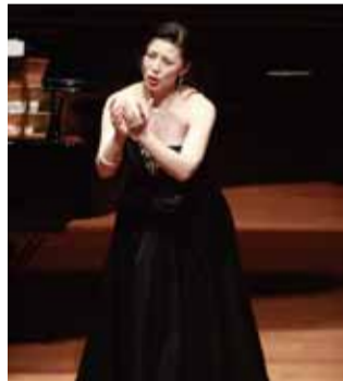
優秀な出演者が集まることで名高いゴールデン・ガーラコンサートは根強い人気で問合せも多い。